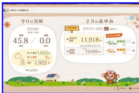
<監視システム・NTTエコメガネ>